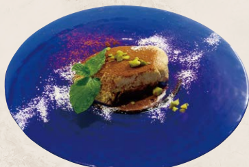
3 本日のティラミス