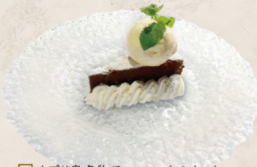
5 カプリ島名物チョコレートのタルト "トルタカプレーゼ"バニラジェラート添え