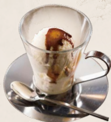
1 バニラジェラートと濃厚エスプレッソの アッフォガード